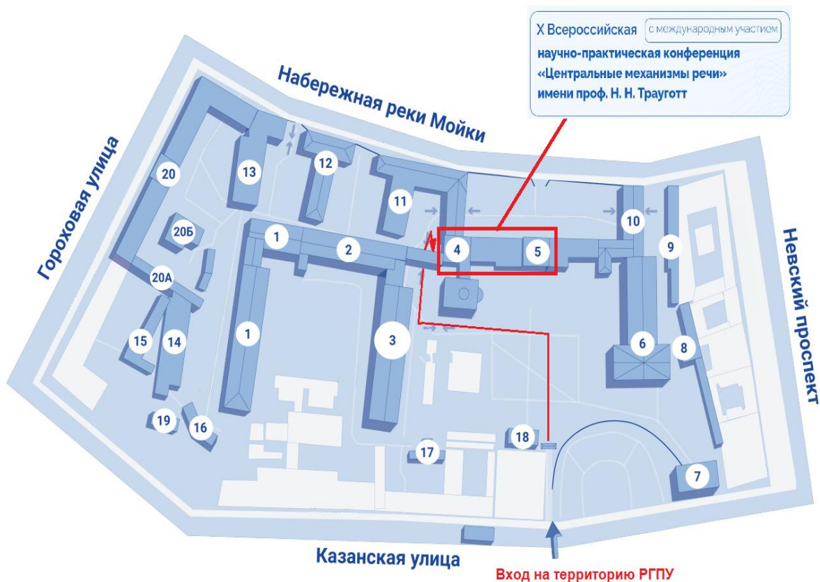
Схема корпусов 4 и 5 РГПУ им. А. И. Герцена